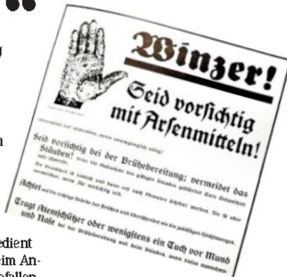
Arsen-Warnung