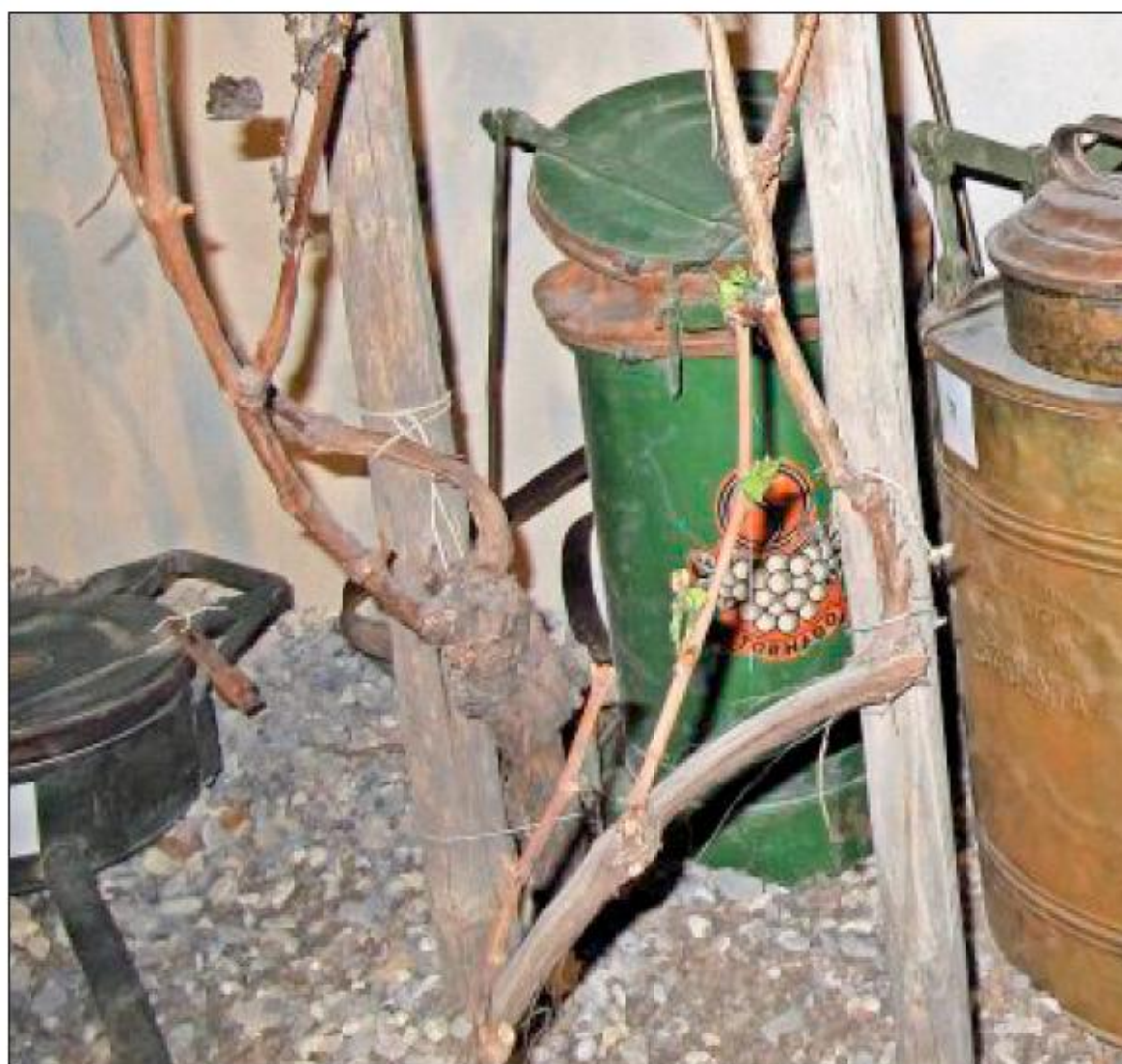
Historische Spritzbehälter, wie sie im Weinbau eingesetzt wurden, sieht man he