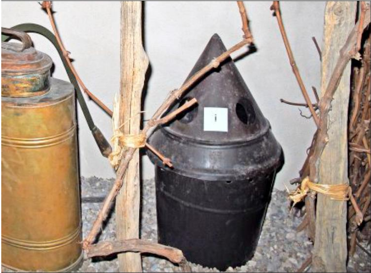
heute noch im Bäder- und Heimatmuseum im Bad Bellinger Ortsteil Bamlach.